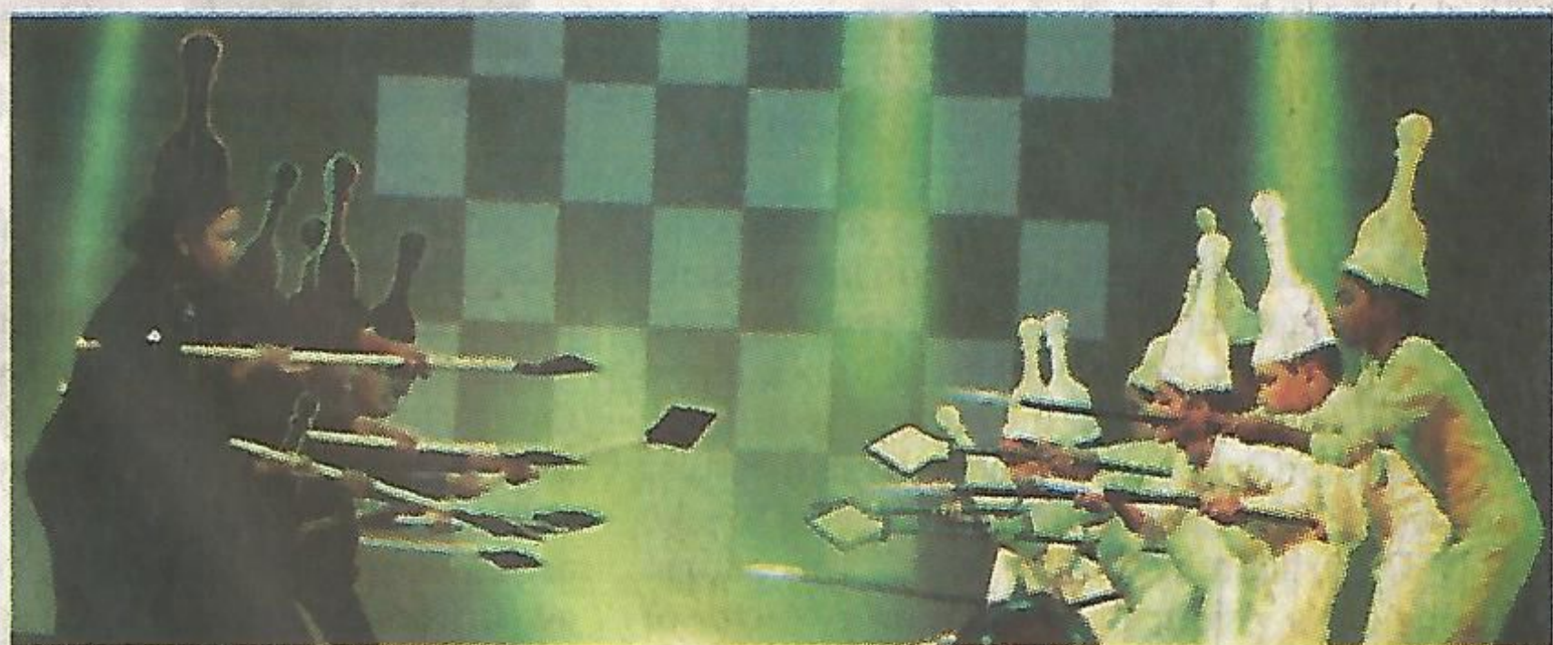
South Point students presenting a ballet at the annual prize distribution ceremony of the school

Lodha said that work on the 'Priyamvada Birla Campus of South Point' at Mukundapur is in its full swing. Adding, that it will be a unique education campus,