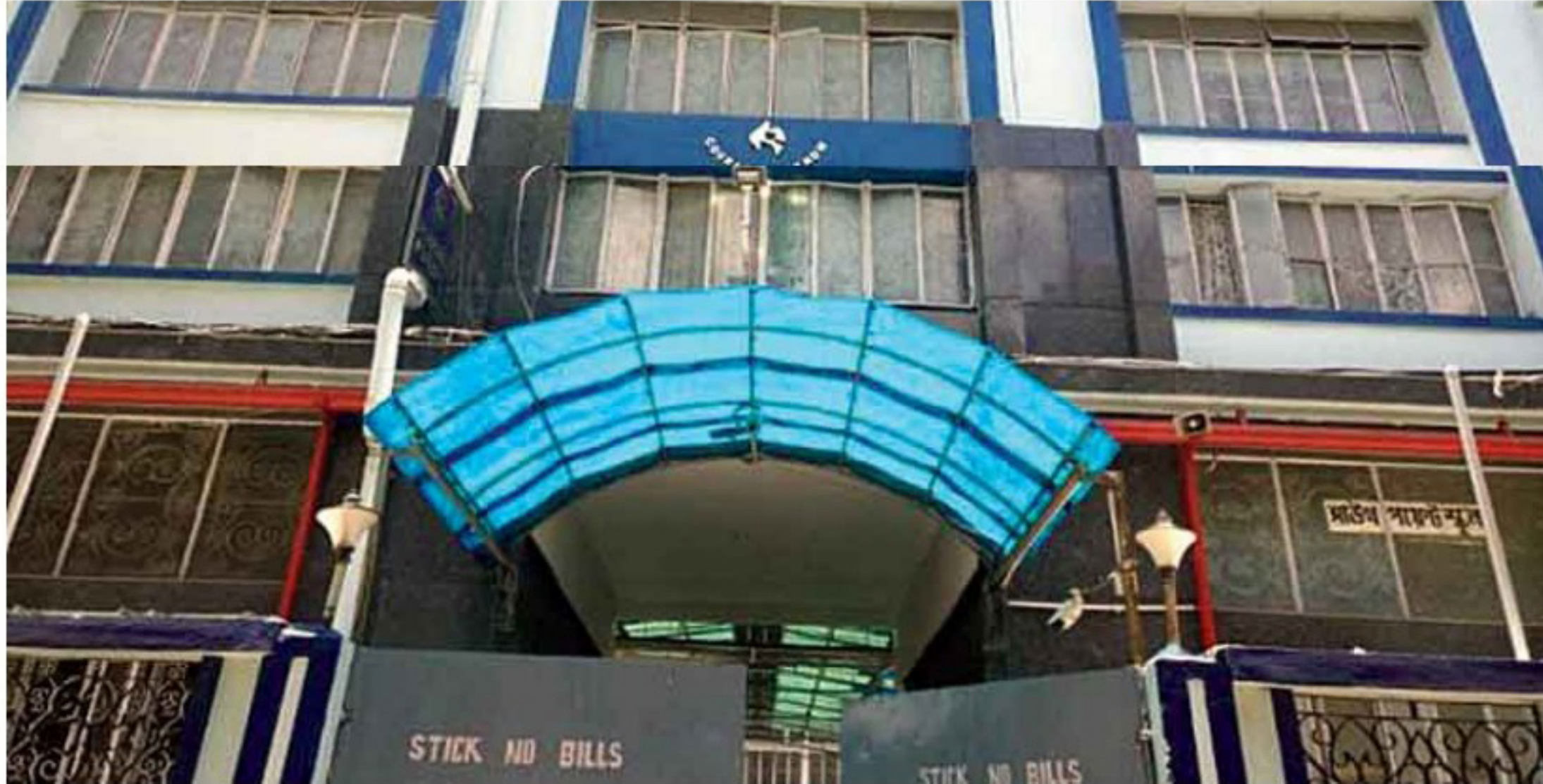
South Point school has started a “Covid helpline” where parents or staff can raise a medical requirement on the school app

Users in need of help will have to raise a ticket through the help desk, with their full name and mobile number, which will be posted on the school app